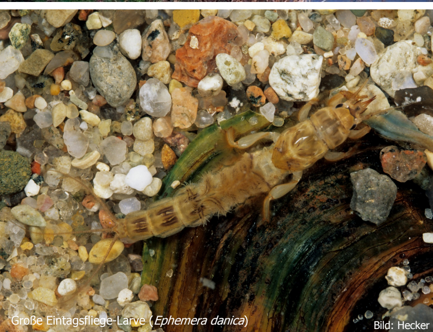
Große Eintagsfliegen-Larve ( Ephemera danica )