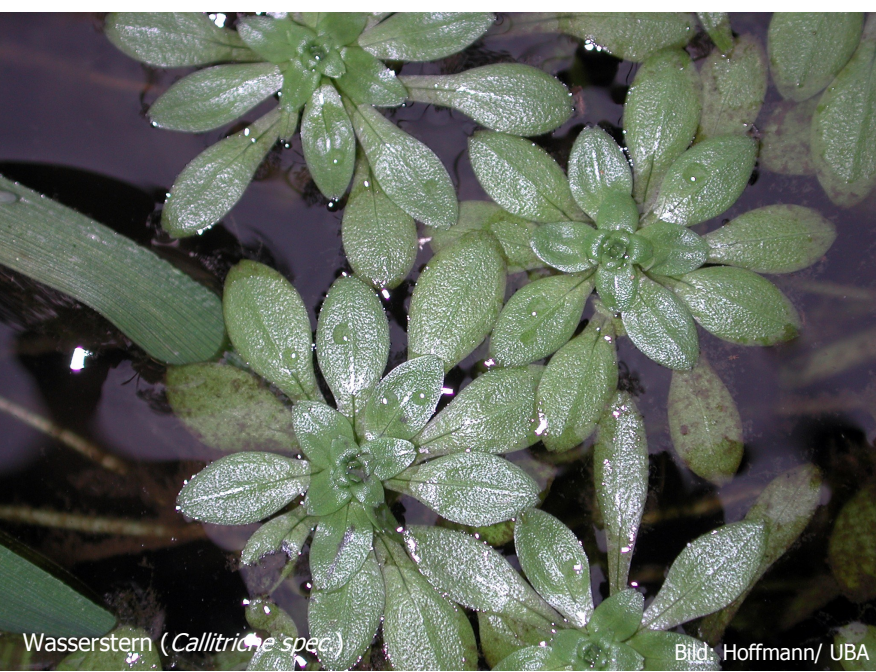
Wasserstern ( Callitriche spec. )