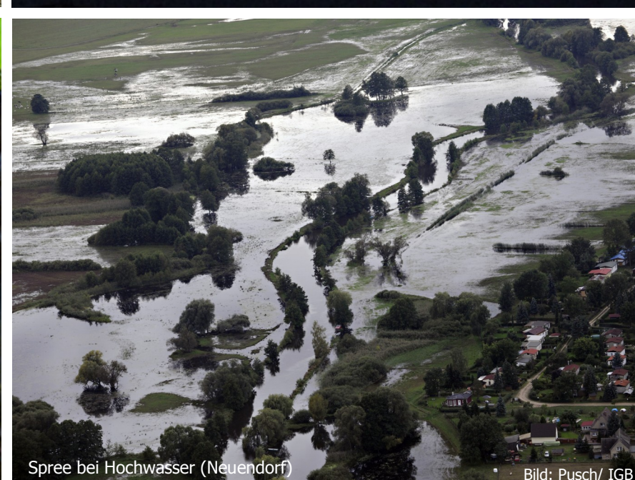
Spree bei Hochwasser (Neuendorf)