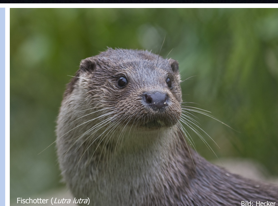
Fischotter ( Lutra lutra )

Poster: Umweltbundesamt — Fachgebiet Binnengewässer