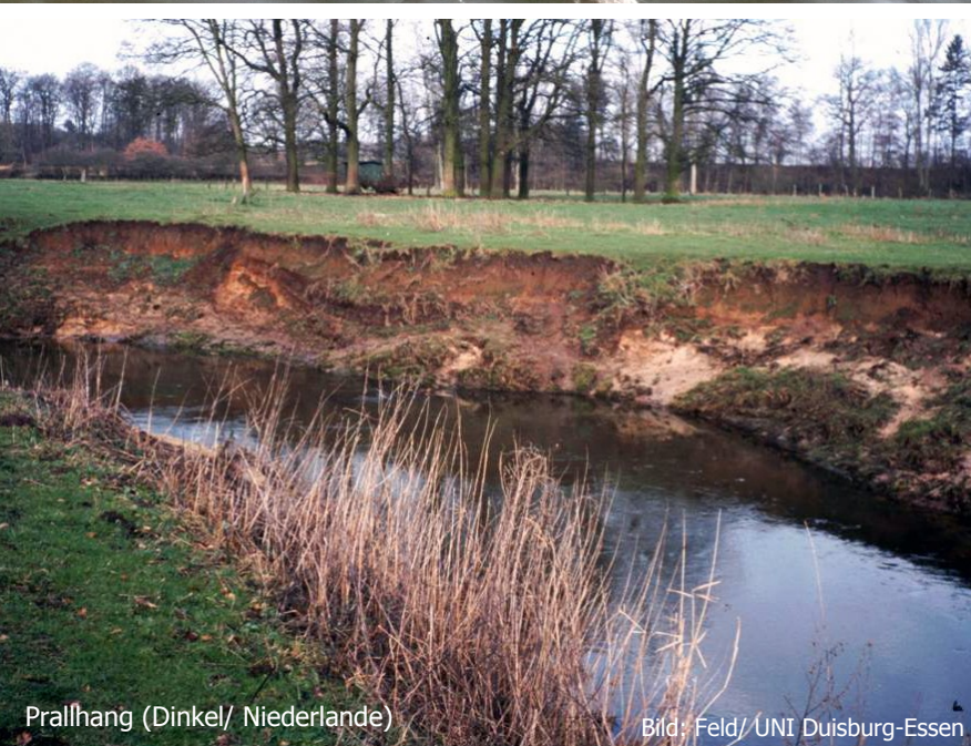
Prallhang (Dinkel/ Niederlande) Bild: Feld/ UNI Duisburg-Essen