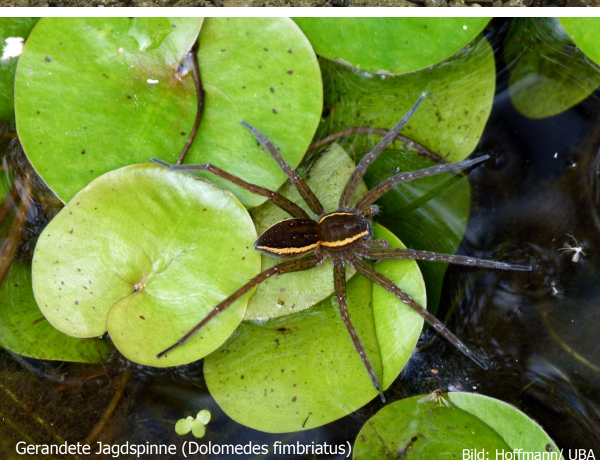
Gerändete Jagdspinne ( Dolomedes fimbriatus )