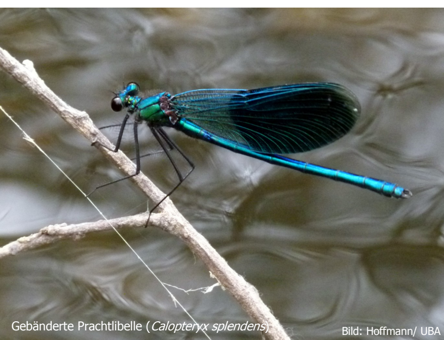
Gebänderte Prachtlibelle ( Calopteryx splendens )