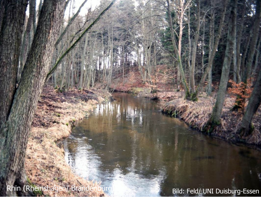
Rhin (Rheinsteiner, Brandenburg)