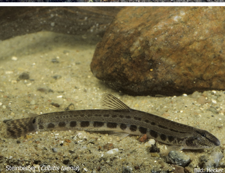
Steinbeißer ( Cobitis taenia )