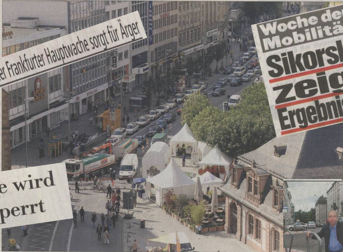
Lange Schlangen vor den Sperrbaken: An der Hauptwache müssen Autos seit gestern rechts abbiegen.

Woche der Mobilität Sikorski zeigt Ergebnisse