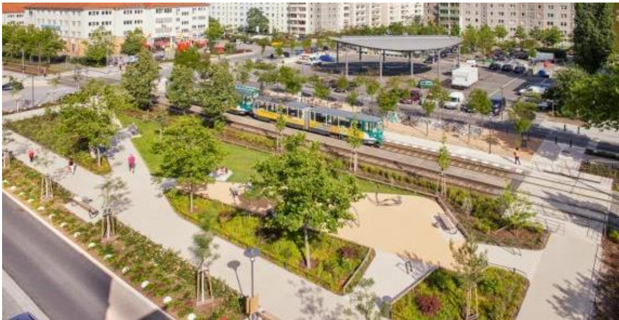
Abbildung 1 Teilstück des Grünen Kreuzes entlang der Konrad-Wolf-Allee