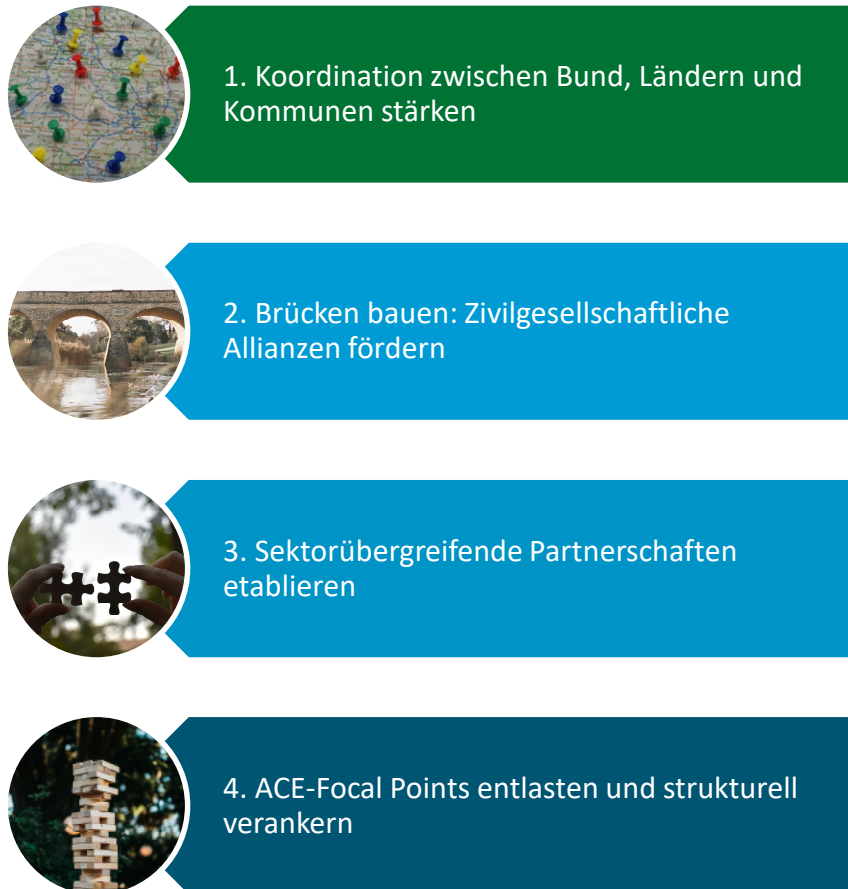
Abbildung 8: Überziele der Koordinations-Ebene

Die ausführlichen Beschreibungen der Überziele stehen in Tabelle 2.