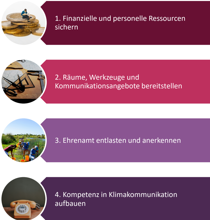
Abbildung 9: Überziele der Unterstützungs-Ebene

Die ausführlichen Beschreibungen der Überziele stehen in Tabelle 2.