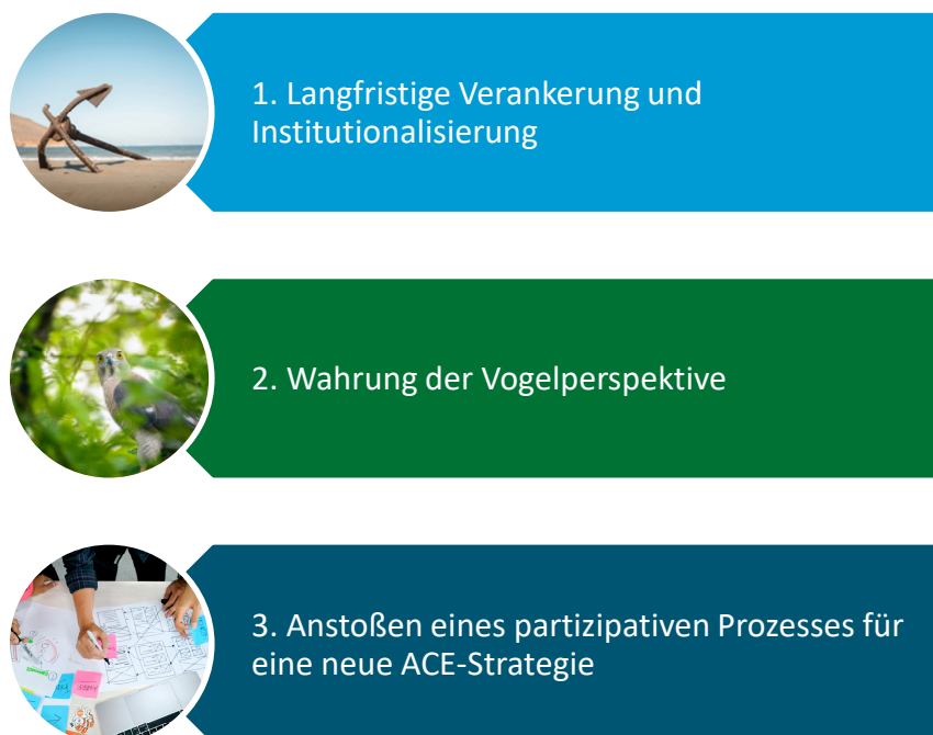
Abbildung 6: Überziele der Strukturebene

Die ausführlichen Beschreibungen der Überziele stehen in Tabelle 2.