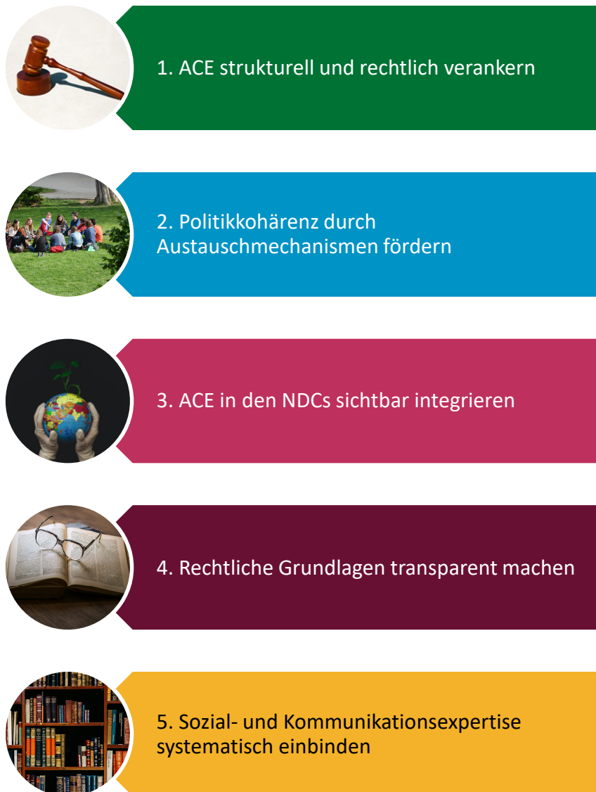
Abbildung 7: Überziele der Politikkohärenz-Ebene

Die ausführlichen Beschreibungen der Überziele stehen in Tabelle 2.