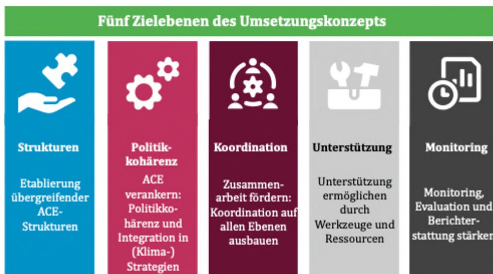
Abbildung 5: Fünf Zielebenen