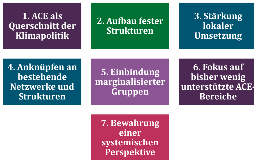
Abbildung 3: Leitprinzipien für die ACE-Umsetzung