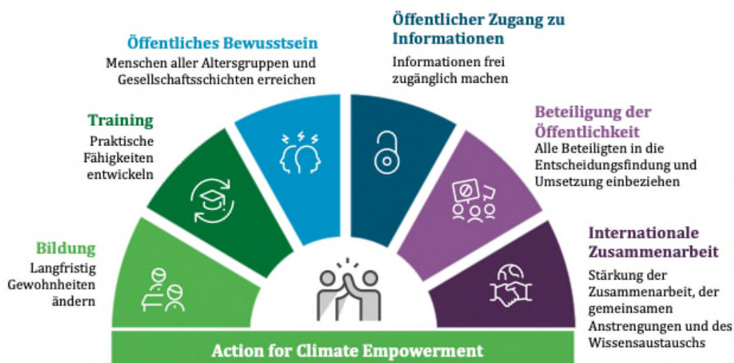
Abbildung 2: Die sechs inhaltlichen Bereiche von ACE