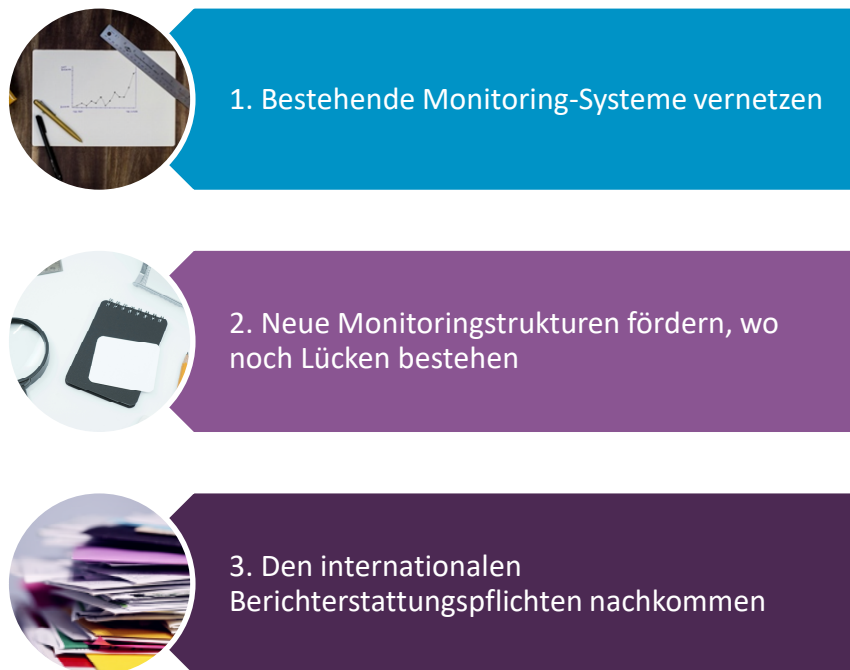
Abbildung 10: Überziele der Monitoring-Ebene

Die ausführlichen Beschreibungen der Überziele stehen in Tabelle 2.