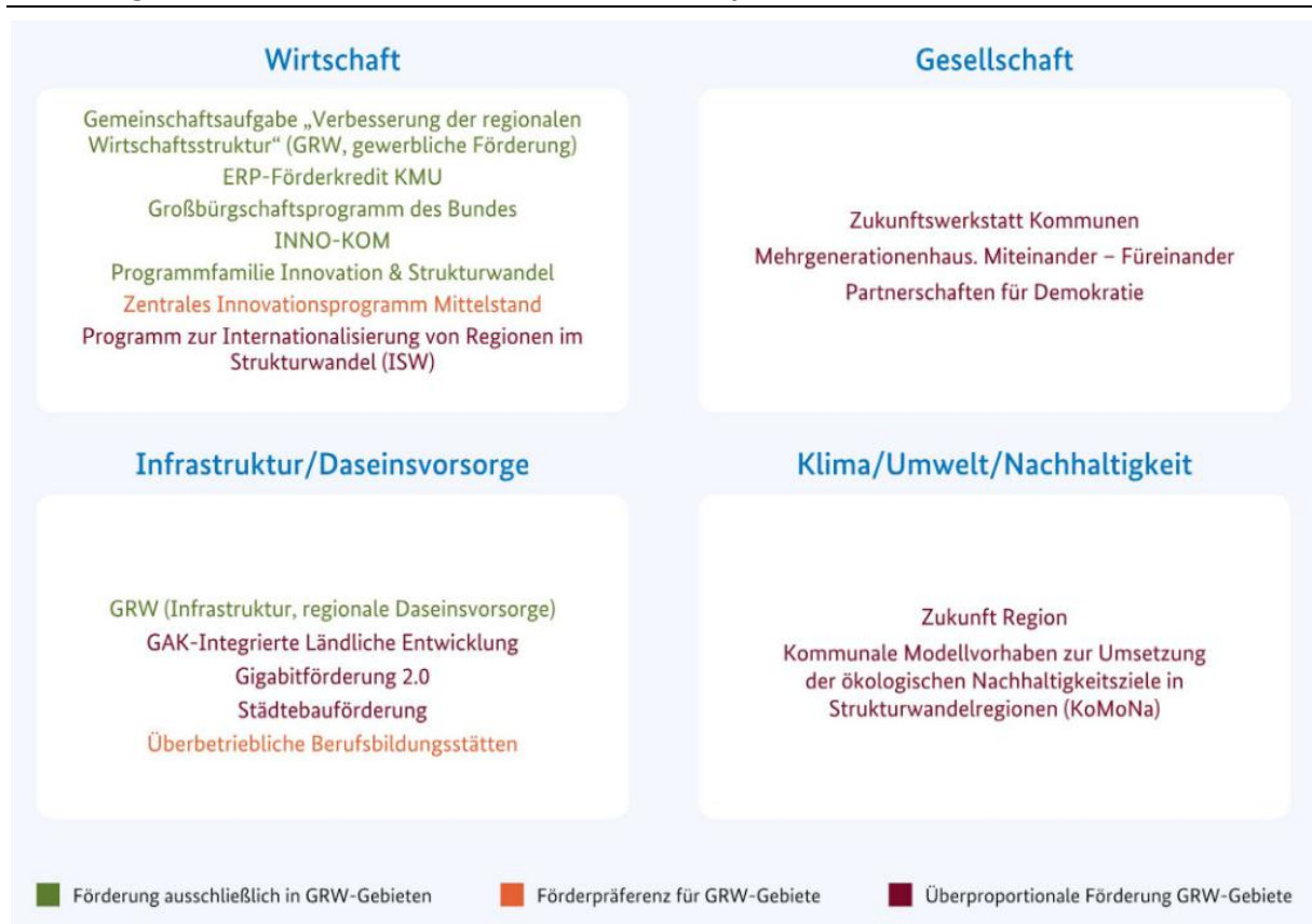
Abbildung 1: Struktur des Gesamtdeutschen Fördersystems

Der Grundansatz zur Ermittlung der etwaigen „Strukturschwäche“ von Regionen wurde dabei jedoch vorerst nicht angepasst und bleibt damit das Leitkriterium für das GFS. Dieser basiert auf verschiedenen Indikatoren, die zu einem gewichteten Gesamtindikator synthetisiert werden (siehe Abschnitt 4.2) und für einen Vergleich sämtlicher Arbeitsmarktregionen angewendet wird, die durch Berufspendlerverflechtungen räumlich voneinander abgegrenzt werden.