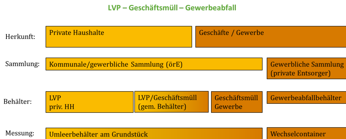
Abbildung 1: Abgrenzung von Siedlungsabfällen nach Herkunft

Die Stichprobenauswahl sowie die Hochrechnung des Geschäftsmülls sind methodisch so angelegt, dass die Anteile privater und gewerblicher Herkunft getrennt ausgewiesen werden können.