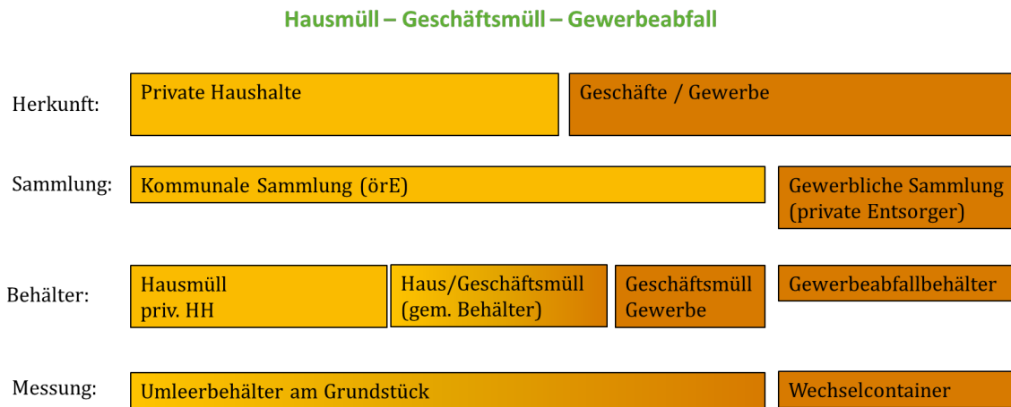
Abbildung 1: Abgrenzung von Siedlungsabfällen nach Herkunft

Die Stichprobenauswahl sowie die Hochrechnung des Geschäftsmülls sind methodisch so angelegt, dass die Anteile privater und gewerblicher Herkunft getrennt ausgewiesen werden können.