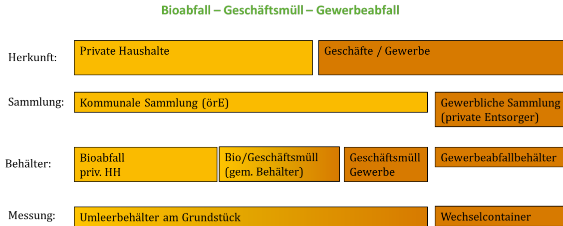
Abbildung 1: Abgrenzung von Siedlungsabfällen nach Herkunft

Die Stichprobenauswahl sowie die Hochrechnung des Geschäftsmülls sind methodisch so angelegt, dass die Anteile privater und gewerblicher Herkunft getrennt ausgewiesen werden können.