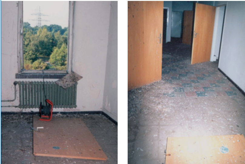
Abbildungen: 3 a,b. Taubenkotkontamination, die gut absaugbar ist

Die Reinigung dieser Arbeitsbereiche sollte daher nicht unter Verwendung von Schaufeln und Besen, Hochdruckreinigern oder durch Abbürsten (s. Abbildung 2) geschehen, da Mikroorganismen bei den beschriebenen Tätigkeiten zusammen mit Staub- oder Flüssigkeitspartikeln verstärkt in die Luft freigesetzt werden.