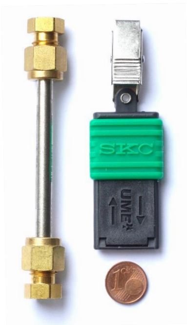
Passivsammler – hängen im Raum und sammeln Schadstoffe

Unsere Mitarbeitenden beantworten gerne Ihre Fragen zu allen die Studie betreffenden Themen.