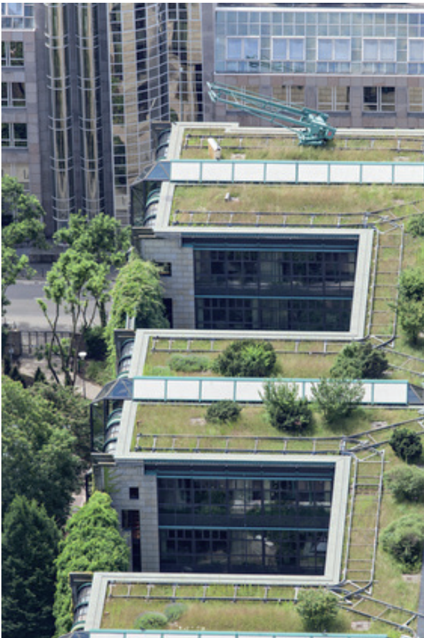
Beispiel 3: Begrünung von Dächern – Eine effiziente Maßnahme gegen Sommerhitze in Städten

Grünflächen wie Parks, Gärten und Alleen haben die Fähigkeit, Niederschlagswasser zu speichern, führen über Verdunstung zu einer Verringerung der Lufttemperatur und können somit den Wärmeinsel-Effekt in Städten reduzieren. In vielen dicht besiedelten Städten besteht am Boden jedoch nur noch wenig Freiraum für Grünflächen. Dachbegrünungen stellen daher eine wichtige Option zur Schaffung weiterer innerstädtischer Grünflächen dar. Dachbegrünungen tragen zur Absorption von Sonnenenergie bei. Sie sind auf den meisten Dächern möglich, insbesondere Flachdächer können zumeist problemlos begrünt werden.