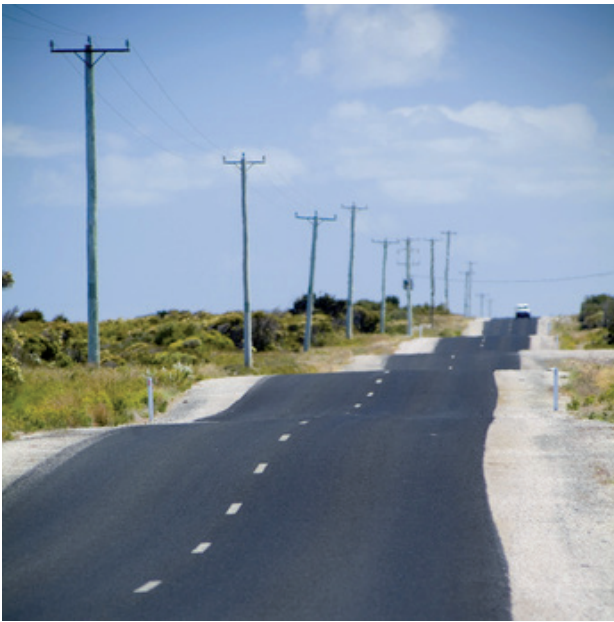
Beispiel 1: Straßen hitzefest machen - Hitzeangepasste Beläge und Fahrbahndecken lohnen sich

Verkehrsinfrastruktur gilt insgesamt als „Kritische Infrastruktur“, da von ihrem Funktionieren viele andere wirtschaftliche und gesellschaftliche Funktionen abhängen. Von den zu erwartenden Klimaänderungen sind für die Verkehrsinfrastruktur insbesondere die Zunahme von Starkregenereignissen, starken Stürmen und Hitzetagen von Bedeutung. Die Fallstudie konzentriert sich auf zunehmende Hitzetage im Sommer. Mögliche Folgen für die Straßen sind etwa Veränderung und Ermüdung im Material, die Zunahme von Spurrinnen, Hitzeaufbrüche und eine andauernde Beanspruchung von Beton und Asphalt über die technische Auslegung hinaus. All dies kann die Funktionsfähigkeit der Straßeninfrastruktur beeinträchtigen. Es entstehen zusätzliche Gefahren, Verkehrsbehinderungen und Straßensperrungen, Unterhaltungsarbeiten werden häufiger und teurer.