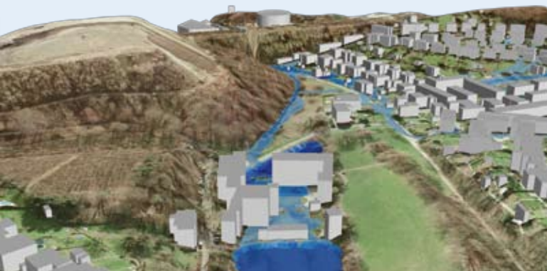
3D-Darstellung aus dem Oberflächenabflussmodell GeoCPM (Dr. Pecher AG)

Als Grundlage dienen unter anderem die Ergebnisse aus mehreren Forschungsvorhaben, an denen die Stadt Wuppertal beteiligt ist. In einer Überflutungsprüfung werden zuerst mittels Satellitenbildern und Laserscanbefliegungen überflutungsgefährdete Mulden ermittelt. Anschließend werden diese Daten mit anderen Daten zu gefährdeten öffentlichen Einrichtungen (Schulen, Krankenhäusern etc.) und kritischer Infrastruktur (Strom, Trinkwasser) verschnitten. In einfachen Fällen mit geringem Schadenspotenzial wird die Überflutungsprüfung um eine Ortsbegehung, Fotodokumentation und detaillierter Erläuterung ergänzt. Bei komplexerer