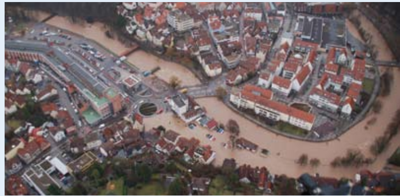
Backnang, Hochwasser Januar 2011

Die HVZ ruft unter anderem aktuelle Wasserstände von rund 265 Bundes- und Landespegeln und rund 390 Niederschlagsmessstationen in Baden-Württemberg und angrenzenden Ländern ab. Sie stellt aktuelle Hoch- und Niedrigwasserinformationen bereit und berät bei der Steuerung der Retentionsräume am Oberrhein. Hierfür werden Informationswege wie Rundfunk, Videotext, Telefonan-