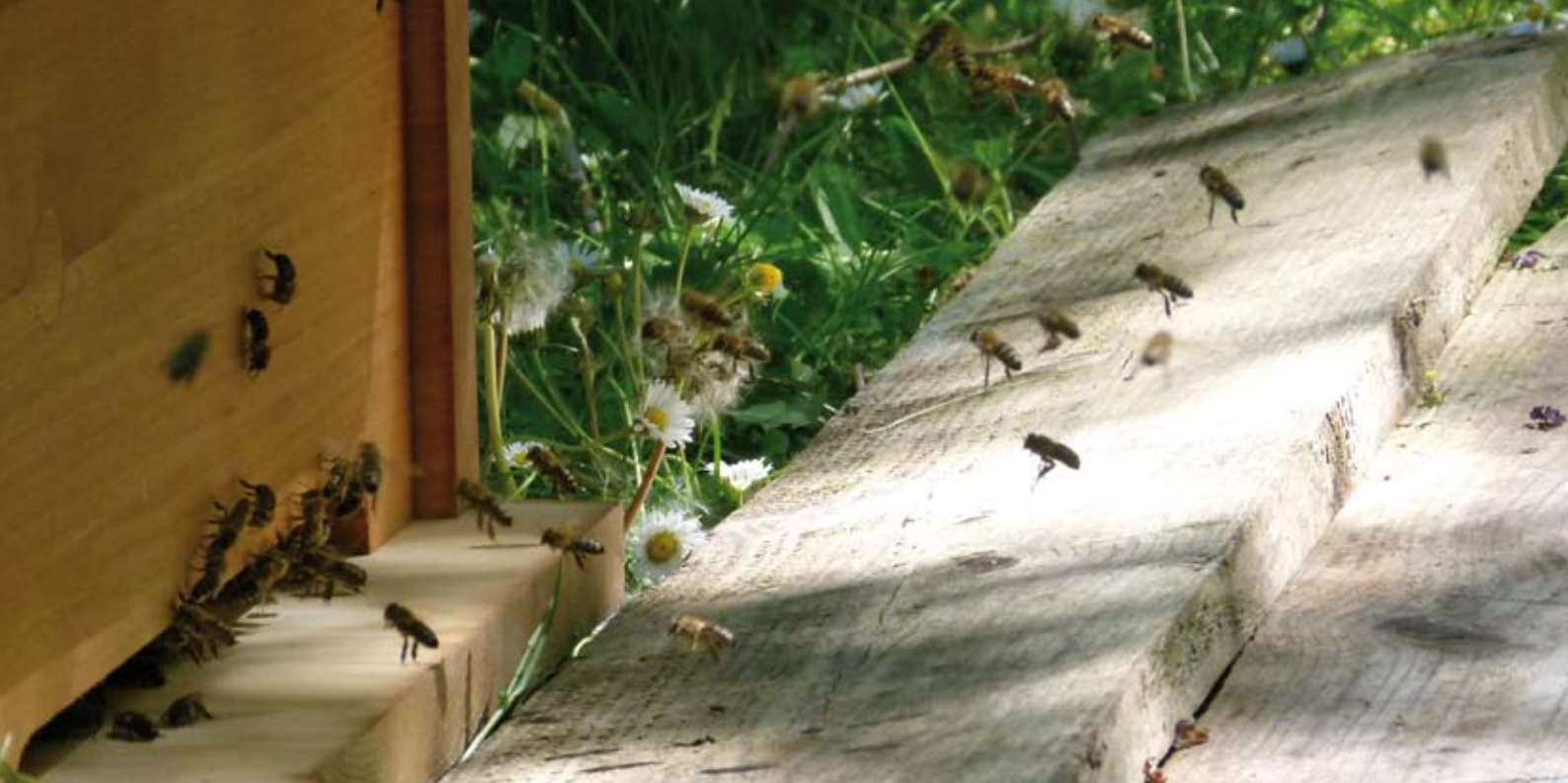
Im Juni 2011 wurde hinter dem Haus das erste Bienenvolk angesiedelt. Im Mittelpunkt steht nicht der Honigertrag, sondern die artgerechte Haltung der Bienen.