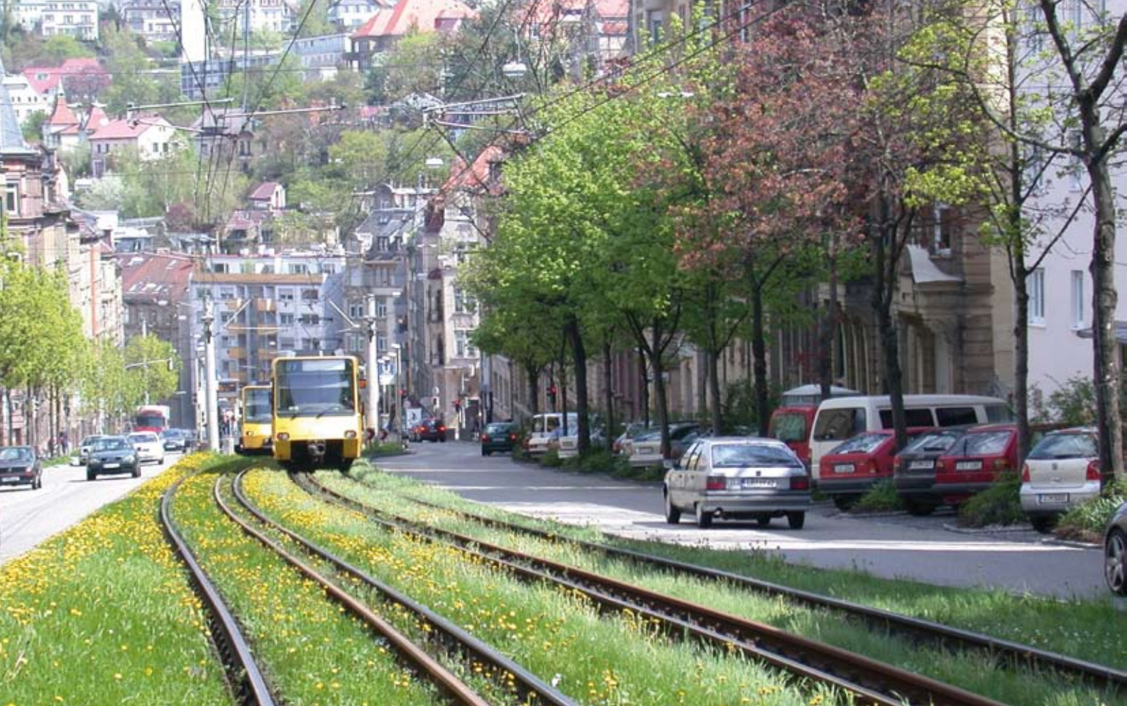
In der Kessellage Stuttgarts sind Grünflächen ein besonders wertvolles Gut