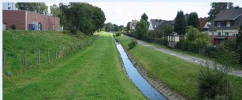
Der „Heereener Mühlbach“ in seiner jetzigen, kanalisiert Form

Mit dem Projekt „Grüne Höfe – Gutes Klima“ zeigt die Grüne Liga, wie ein Umweltverband mit relativ geringem Budget Initiativen anregen und unterstützen kann, die der Klimaanpassung ebenso wie der ökologischen Stadtentwicklung und der Lebensqualität dienen. www.hofbegruenung.grueneliga-berlin.de