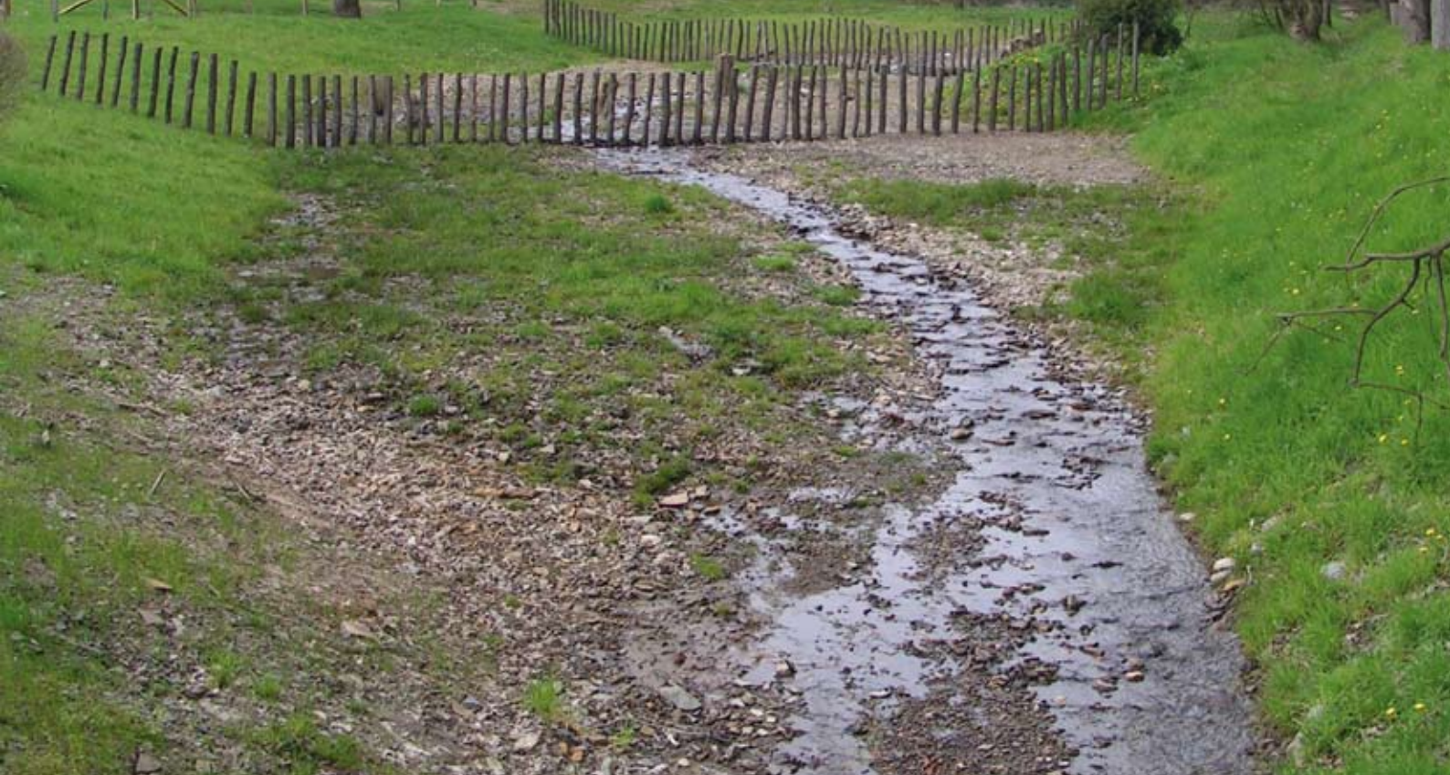
Der Bach Filscheidsiepen wurde in die angrenzende Wiese verlegt, aufgeweitet und mit Auffangvorrichtungen für Geschwemmsel versehen.