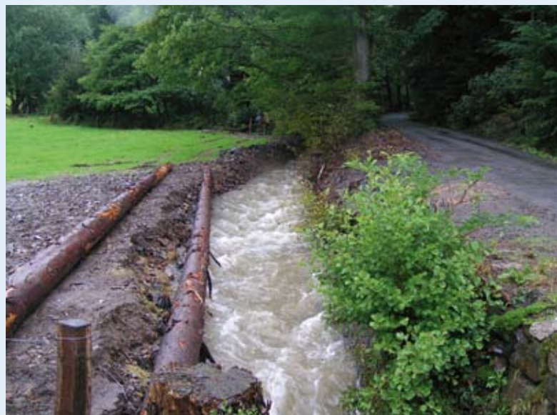
Das Filscheidsiepen vor der Umgestaltung als straßenbegleitender, begradigter Bach.

Die Anliegerinnen und Anlieger brachten für die Maßnahmen einige Opfer: Etliche stellten Teile ihrer Grundstücke ohne Entschädigung zur Verfügung. So manches Gartenhäuschen musste versetzt oder abgerissen werden. Dafür wurde die Sicherheit für mehrere hundert Anwohnerinnen und Anwohner erhöht und gleichzeitig der Wert der Grundstücke gesteigert. Das Beispiel in Arnberg zeigt, wie wichtig es ist, Betroffene einzubinden. Ohne ihre Mithilfe wäre die Umsetzung der Maßnahmen nicht möglich.