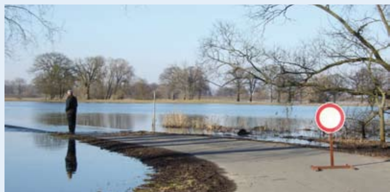
Technischer Hochwasserschutz oder Ausweitung der Überschwemmungsgebiete: Der Klimawandel verschärft die Diskussion in den Anrainergemeinden der Elbe.

Auch wenn das Leitbild sich erst in der konkreten Umsetzung bewähren kann: Die Bevölkerung hat sich bereits jetzt umfassend mit den Themen Klimawandel und Anpassung auseinandergesetzt. Das bildet einen wertvollen Ausgangspunkt für weitere Aktivitäten. Der Prozess kann – auch ohne entsprechende Forschungsmittel – eine Anregung für andere Gemeinden bieten.