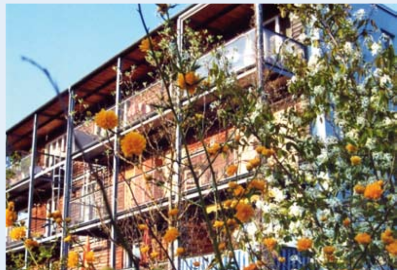
Das Haus im Frühjahr

Nicht alle umgesetzten Ideen stießen von Anfang an auf einhellige Zustimmung. Probleme werden auf den Hausversammlungen intensiv diskutiert. So konnten Vorbehalte ausgeräumt und alle Maßnahmen schließlich einstimmig beschlossen werden. Der Dialog wird weitergeführt – nicht nur innerhalb der Hausgemeinschaft, sondern auch im Stadtteil und darüber hinaus. Das weckt Interesse für solche Konzepte, gibt neue Ideen und stößt Kooperationen an.