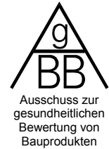
Abb. 1: SCHEMA ZUR GESUNDHEITLICHEN BEWERTUNG VON VOC*- UND SVOC*-EMISSIONEN AUS BAUPRODUKTEN