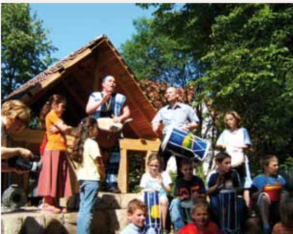
Pueblo Eine-Welt en Minden, gracias a la numerosa ayuda, ha creado un nuevo albergue: la casa Grodno. Su nombre proviene de la larga colaboración entre las ciudades de Grodno (Bielorrusia) y Minden iniciada por la “Comunidad de Acción Friedenswoche.