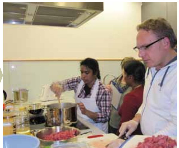
Cocina cultural de Aalen – Encuentro culinario en equipo

La cooperación internacional funciona especialmente bien si las personas pueden construir y diseñar algo juntas y, a través de su trabajo conjunto, tanto transmitir su propia cultura como desarrollar entendimiento hacia las demás. Actividades de acceso sencillo, como la cocina o jardinería conjuntas, facilitan la integración y abren la puerta a otras actividades.