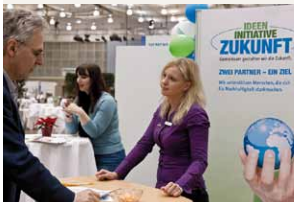
“Ideas para un futuro emprendedor” se presenta en el 5º Congreso 21 en Hannover

Este modelo también se transmite a los clientes de dm: pueden comenzar a utilizar electricidad verde, de manera sencilla y sin gastos adicionales, con los paquetes de iniciación de los proveedores alternativos EWS en la Selva Negra y LichtBlick en Hamburgo. Si cierran el contrato, los clientes reciben una tarjeta regalo de dm por valor de 50 euros. Desde la introducción de estos paquetes de iniciación en el 2011, 3.200 hogares alemanes se han pasado a la electricidad verde. www.projekte.ideen-initiative-zukunft.de