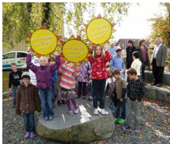
Proyecto escolar para la transición energética en el distrito de Fürstenfeldbruck – los niños se implican activamente

Por lo tanto, en Alemania, el Consejo Asesor sobre el Cambio Climático (WBGU) ha propuesto un nuevo “contrato social para una gran transformación”. Esta “gran transformación” se llevará a cabo y se sentirá especialmente en ciudades. En ellas, por un lado, el consumo y las emisiones son especialmente elevadas y, por otro, se dispone de numerosos potenciales de diseño y transformación (véase WBGU “Un mundo en transición. Contrato social para una gran transformación”, Berlín 2011).