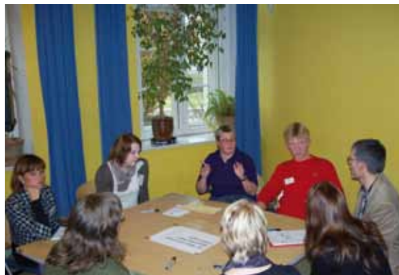
Presentación "Presupuestos participativos – Experiencias y perspectivas" en Weimar en 2011

Por lo general, en la realización de un presupuesto participativo sólo influyen las aportaciones voluntarias e un municipio. En los presupuestos muni-