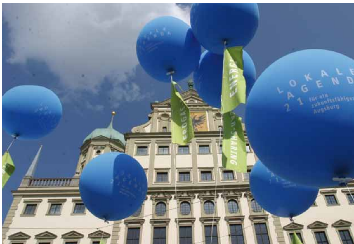
Acción de la Agenda en la plaza del Ayuntamiento de Augsburg

Otra posibilidad de incluir la participación para el desarrollo y la implementación de objetivos de sostenibilidad también a nivel estratégico viene dado con la introducción de un examen de sostenibilidad de los proyectos del consejo. Este nuevo instrumento de política municipal de un examen de sostenibilidad se puso en marcha por la tendencia, tanto a nivel del Estado federado de Baden-Württemberg como en el gobierno federal y en el Bundestag, de realizar exámenes de sostenibilidad en el marco de las evaluaciones de impacto de leyes, y porque cada vez más municipios muestran su interés en este concepto. Debido a la importancia del control y evaluación para una reestructuración eficiente hacia la sostenibilidad, el examen de sostenibilidad será en el futuro un instrumento incluso más importante. ■