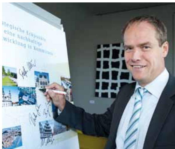
El alcalde de Heidelberg firma, en el Consejo para el Desarrollo Sostenible, las bases estratégicas para un desarrollo sostenible en el municipio

Bajo el título “se ha hecho mucho, queda más por hacer”, los municipios y actores locales en la “Declaración Río+20” se refieren al principio que dice que un desarrollo sostenible debe realizarse especialmente in situ y que las modificaciones profundas deben ser medibles. La reestructuración socioecológica necesaria en la economía y en la sociedad, sólo puede lograrse mediante los esfuerzos conjuntos de política, administración, economía y sociedad civil, donde estos esfuerzos deben intensificarse. Con vistas al cambio