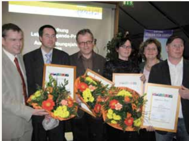
Entrega del premio Agenda de Leipzig en 2009

Para reconocer el gran compromiso de muchos actores locales y para mantenerlos en el tiempo, la ciudad concede todos los años el premio Agenda en varias categorías. El premio se entrega en cooperación con la compañía eléctrica Leipzig GmbH, VNG – Verbundnetz GAS AG, la Caja de Ahorros de Leipzig y la fundación “Ciudadanos por Leipzig”. Además del reconocimiento público, se incluye un premio en metálico que se utiliza por parte de iniciativas de la sociedad civil para la implementación de proyectos innovadores. Con el premio Agenda, también se fomenta en Leipzig la cooperación con inmigrantes. Así, en el año 2001,