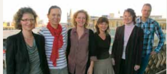
Equipo del proyecto “Comprar futuro” en el Instituto para la Iglesia y la Sociedad de la Iglesia Evangélica de Westfalia

La introducción de una administración de compras sostenible se consigue con el apoyo, paso a paso, del equipo asesor. Tras un análisis