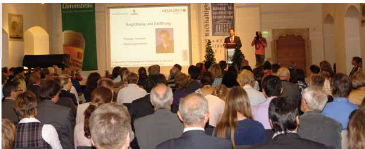
Conferencia sobre sostenibilidad en Neumarkt

El compromiso ciudadano es especialmente importante para mantener la motivación a largo plazo y para renovarla. Numerosos municipios conceden, por ejemplo, un premio en base a la sostenibilidad o a la agenda, mostrando así su valoración del trabajo realizado.