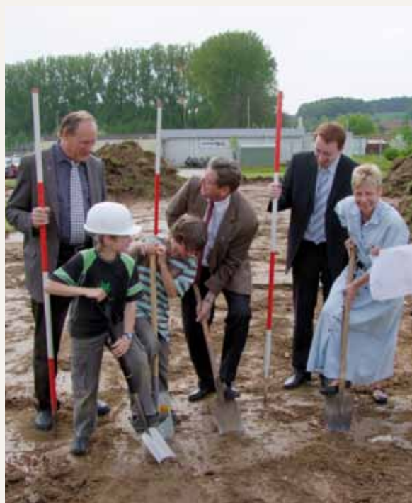
Palada para la construcción del espacio multifuncional