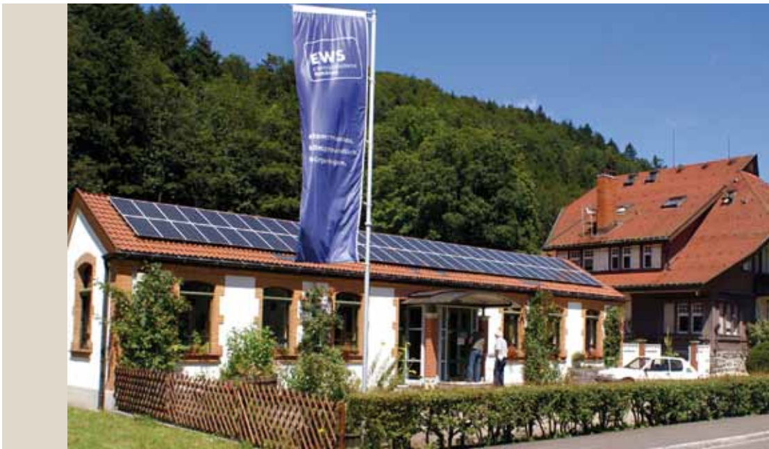
Oficinas de las Centrales Eléctricas de Schönau (EWS)