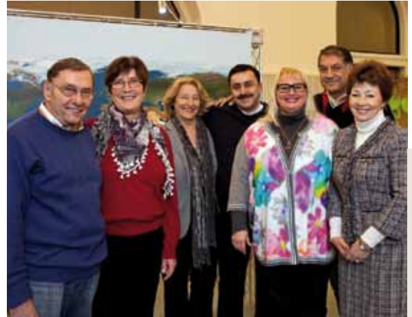
Los guías de integración reciben su cualificación como guías medioambientales en Hannover; La oficina Agenda 21 es socia de cooperación de la capital de Baja Sajonia.