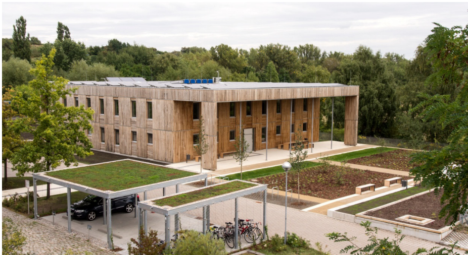
Haus 2019 am Standort des Umweltbundesamtes in Berlin-Marienfelde