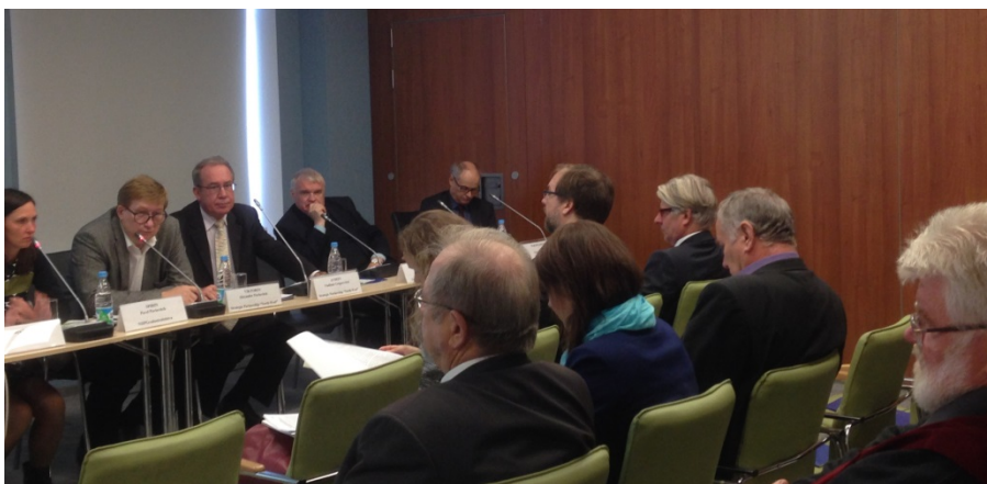
Фото 6: Дискуссия в офисе стратегического партнерства «Северо-Запад»