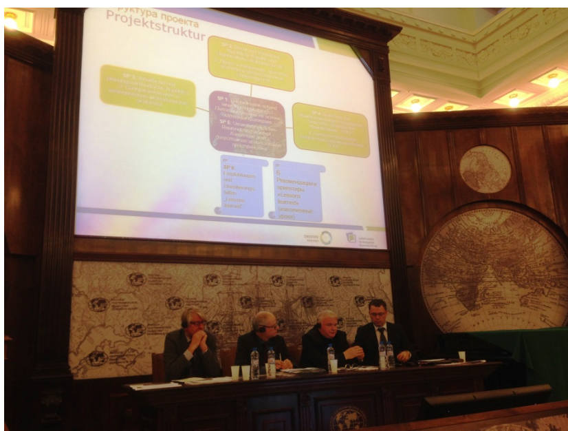
Фото 9: Обсуждение дизайна пилотного проекта