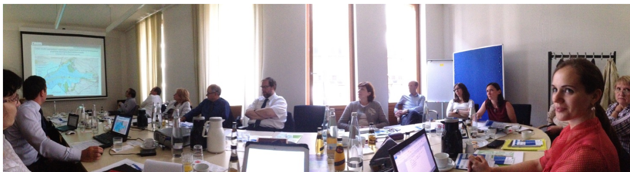
Фото 1: Дискуссия о правовой базе в Германии, России, а также на международном и региональном уровне