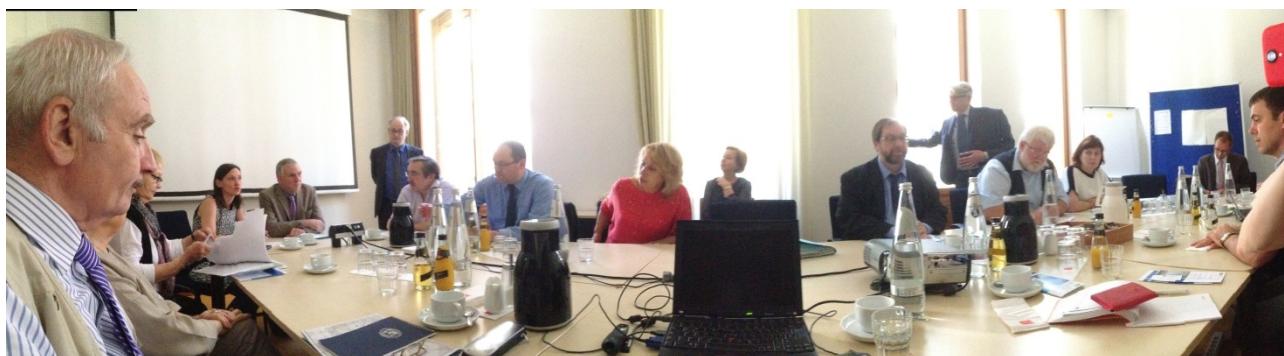
Фото 4: Открытие заседания. Приветственная речь статс-секретаря Йохена Фласбарта (Федеральное министерство окружающей среды, охраны природы и безопасности ядерных реакторов Германии (BMUB))