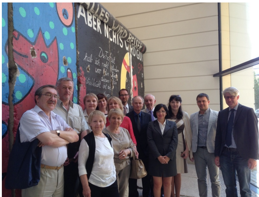
Фото 5: Групповое фото около „Берлинской стены“ в здании Федерального министерства окружающей среды, охраны природы и безопасности ядерных реакторов Германии (BMUB)