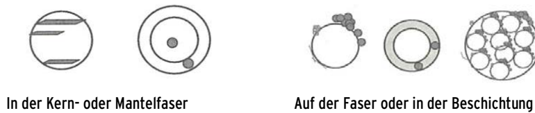
Abbildung 1: Möglichkeiten der Einbettung von Nanomaterialien in Textilien (nach Bickel und Som 2011)

Bei Textilien, die aus Nanostrukturen bestehen, handelt es sich beispielsweise um Fasern mit einem Durchmesser im nanoskaligen Bereich oder um Fasern und Beschichtungen mit Nanoporen (siehe Abbildung 2).