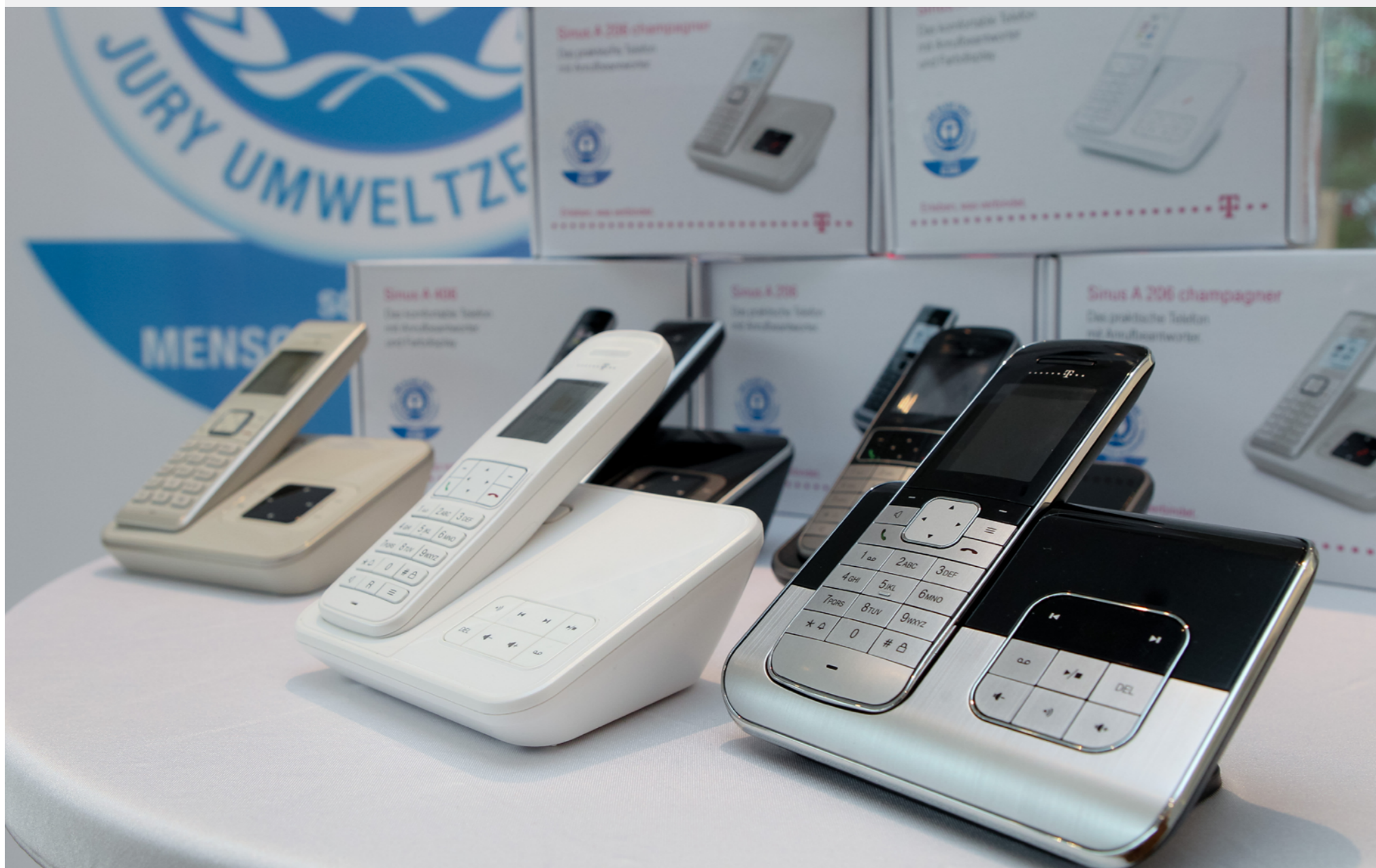
Energieeffiziente und strahlungsarme Schnurlostelefone mit dem Blauen Engel

Schnurlostelefone sind beim Verbraucher immer beliebter und aus vielen Wohnungen und Büros nicht mehr wegzudenken. Um eine lange Lebensdauer zu ermöglichen, fordert der Blaue Engel, dass die wiederaufladbaren Batterien vom Nutzer einfach ausgetauscht werden können und im Handel frei erhältlich sein müssen.