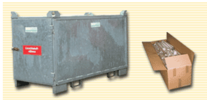
Abb.3: Mögliche Behältnisse für den Transport nicht gefährlicher Altlampen

Für kleinere Lampen, wie Energiesparlampen, sind 200-Liter-Spannring-Deckelfässer oder kleine Gitterboxpaletten die beste Wahl.