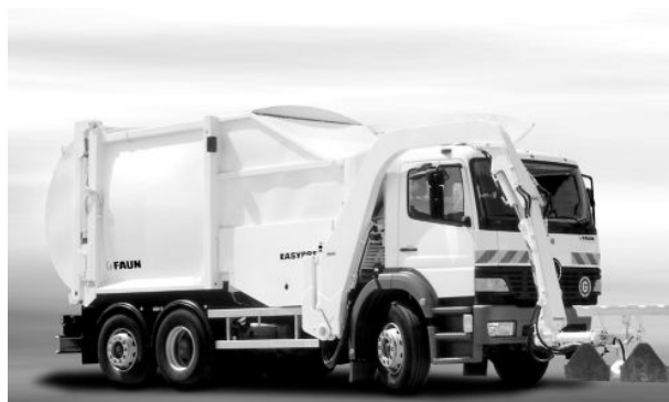
Abb. 3: Frontseitenlader