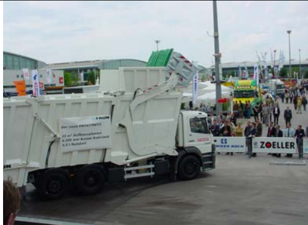
Abb. 2: Frontlader mit Festaufbau