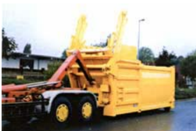
Abb. 4: wechselbares Frontlader-System auf Abrollcontainer-Chassis