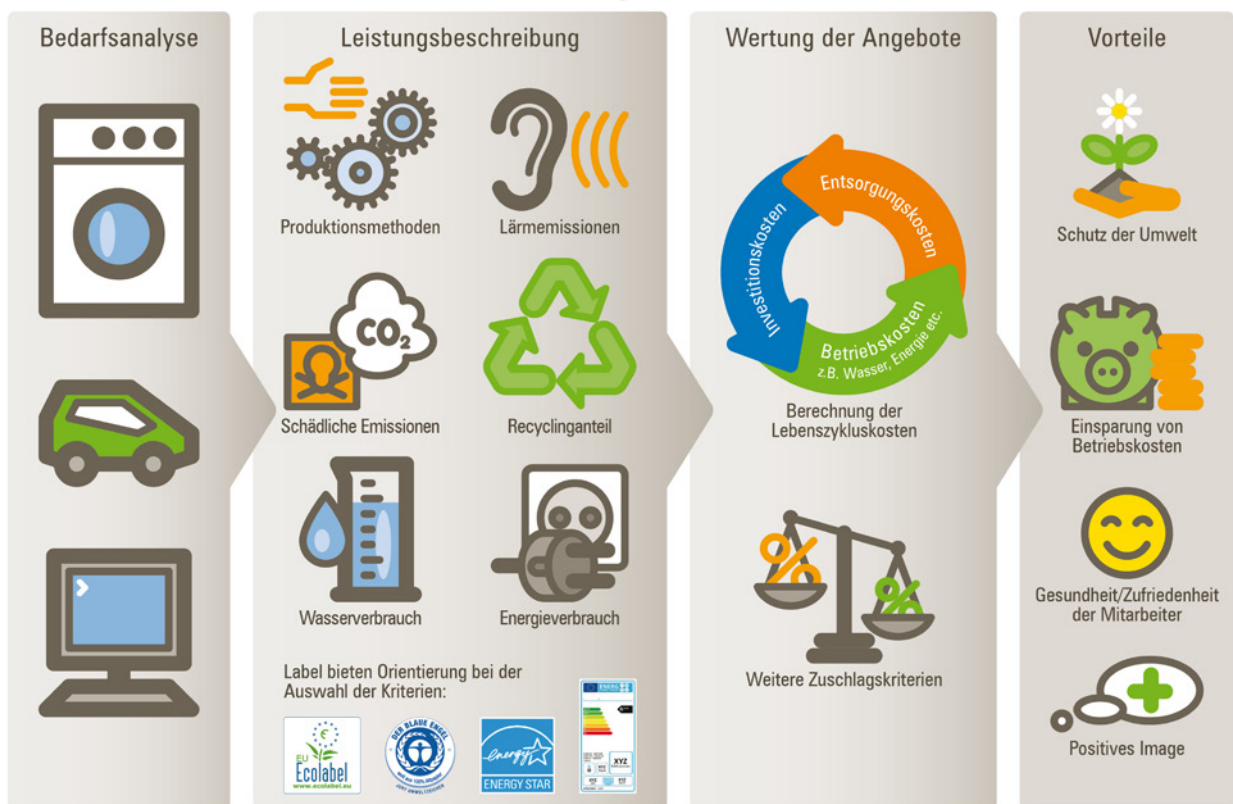
Abbildung 1: Schematischer Überblick über Umweltaspekte im Vergabeverfahren, Berliner NetzwerkE ( www.berliner-netzwerk-e.de )