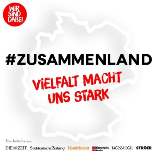
Abbildung 2: #Zusammenland – Vielfalt macht uns stark

Bereits 20 Ressortforschungseinrichtungen haben zugesagt. Wir konnten in den letzten Wochen weitere Ressortforschungseinrichtungen für die Initiative gewinnen und in den kommenden Tagen werden mehr hinzukommen.