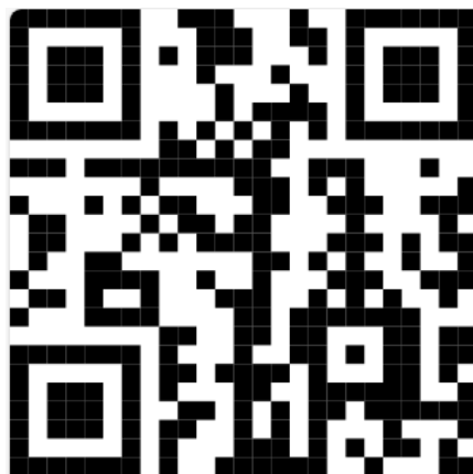
Abbildung 1: QR-Code zur Umfrage