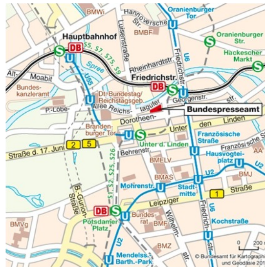
Tagungsort am 06.12.2013: Presse- und Besucherzentrum Reichstagsufer 14, 10117 Berlin

Da keine Parkplätze zur Verfügung stehen, empfehlen wir die Benutzung öffentlicher Verkehrsmittel: 05.12.2013: S- und U-Bahn-Haltestelle "Potsdamer Platz": 3 Minuten Fußweg über Ebertstraße Richtung Brandenburger Tor. 06.12.2013: S- und U-Bahn-Haltestelle "Friedrichstraße"