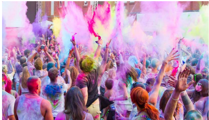
Abbildung 1: Typische Situation beim Farbwurf nach Countdown.

Holi-Feste sind derzeit bei Jugendlichen und jungen Erwachsenen in Deutschland sehr beliebte Open-Air-Veranstaltungen. Während dieser Musikveranstaltungen werden spezielle Farbpulver (Holi-Farben) in stündlichen Abständen in die Luft geworfen („Countdowns“) und zusätzlich zum gegenseitigen Bewerfen und zur Dekoration der Haare, der Haut und der Kleidung verwendet ( Abbildung 1 ).