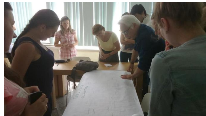
Студенты и аспиранты кафедры ихтиологии и экологии прошли стажировку в Италии // http://www.klgtu.ru/press/news/18389.php