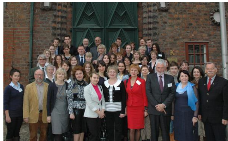
Российско-германский кооперативный проект «Учебные ландшафты для устойчивого развития в регионах Люнебурга и Калининграда» (2009-2012 гг.) // https://www.kantiana.ru/news/145/74277/?sphrase_id=170806