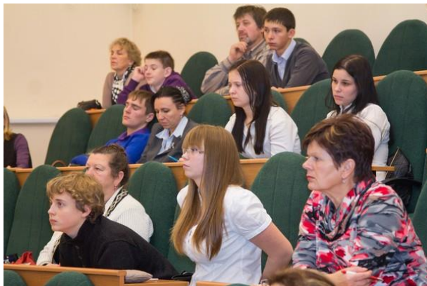
В университете начинает работать энергетический патруль // https://www.kantiana.ru/news/142/92373/?sphrase_id=170881