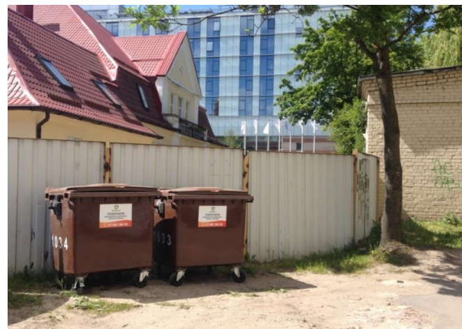
КГТУ включился в работу по селективному сбору отходов // http://www.klgtu.ru/press/news/18214.php