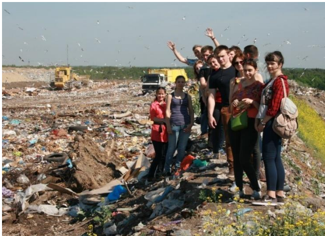
Студенты-экологи КГТУ завершили обучение в рамках проекта ХЕЛКОМ // http://www.klgtu.ru/press/news/16540.php