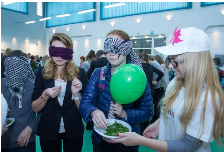
Дни Европы БФУ им. И. Канта продолжились ЭКО – квестом // https://www.kantiana.ru/news/142/113072/?sphrase_id=170881