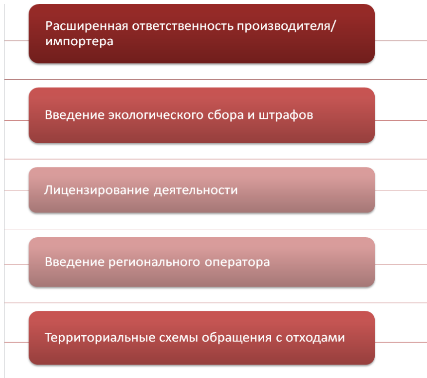
Изображение 2: Области регулирования новых подзаконных актов ФЗ- № 458

С помощью анкет для участников конференции (см. Приложение 9) проведена оценка мероприятия. Помимо организационных моментов, особое внимание уделялось оценке содержательной части конференции (темы докладов, качество перевода, подиумная дискуссия и пр.) Общий бал оценки мероприятия составил 9 из возможных 10. Также в анкете помимо отзывов, участники могли оставить предложения по интересующим темам и вопросам, не затронутым в рамках конференции. Ниже на изображении 3 приведены темы, указанные как наиболее востребованные, из чего следует, что практически во всех основных сферах деятельности сектора обращения с отходами существует потребность в консультациях и дальнейшей информации касательно ноу-хау и передовых практик.