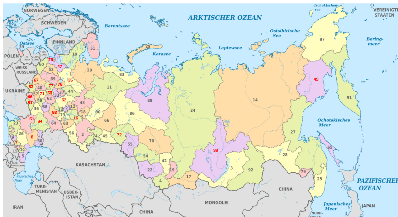
Изображение 1: Деление Российской Федерации на федеральные субъекты