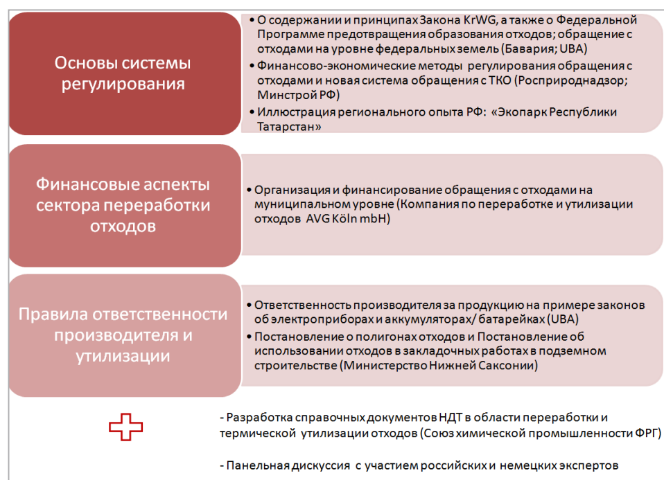
Изображение 4: Разделение программы на тематические блоки

Обзор тематических блоков программы с соответствующими докладами