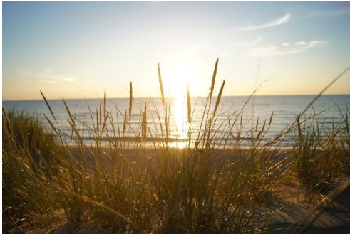
Прибрежный ландшафт Куршской косы