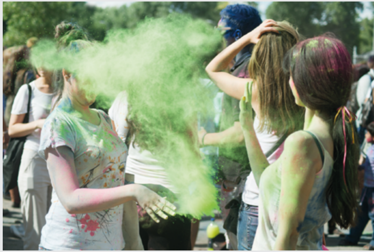
Abbildung 1: Besucherinnen eines Holi-Festivals bewerfen sich mit Farbpulver.

einer Internetrecherche, bei der insgesamt 139 Veranstaltungen ermittelt wurden. Aufgrund von Zeitungsberichten zu einigen Holi-Festivals wurden je nach Größe der Stadt, in der die Veranstaltung stattgefunden hat, die in Tabelle 1 angegebenen Teilnehmerzahlen angenommen. Legt man diese Daten zugrunde, resultiert eine Zahl von circa 650.000 Teilnehmenden.