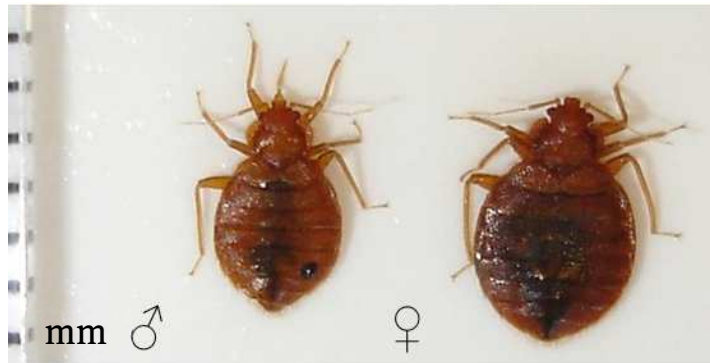
Punaises de lit adultes ( Cimex lectularius )