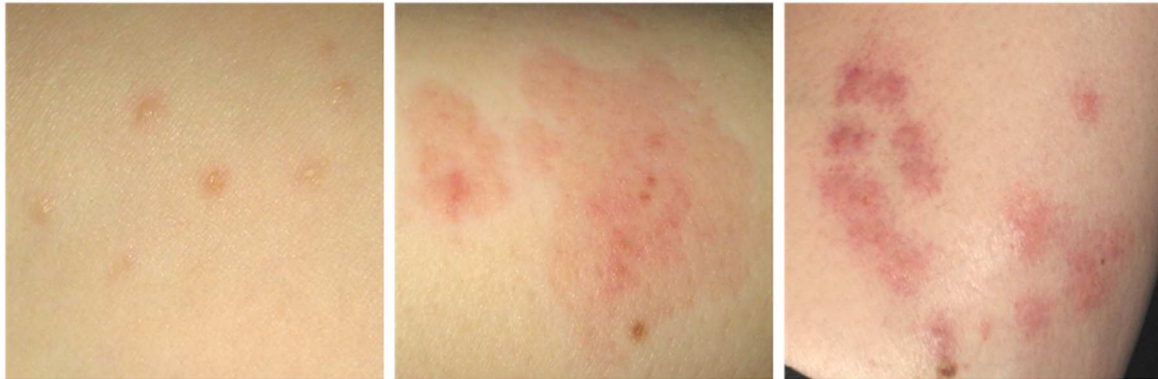
Différentes réactions cutanées aux piqûres de punaises de lit

L'apparence d'une piqûre de punaise de lit peut varier d'une personne à l'autre. Certaines personnes n'ont aucune lésion sur la peau alors que d'autres présentent une réaction allergique plus intense. Les piqûres sont généralement regroupées au même endroit car la punaise de lit doit piquer à plusieurs reprises avant d'avoir accès au sang. Les piqûres de punaises de lit peuvent être facilement confondues avec celles d'autres insectes. Les piqûres sont visibles la plupart du temps le matin mais peuvent apparaître seulement quelques jours plus tard chez certaines personnes.