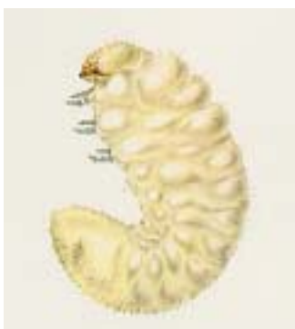
Bild 2: Schematische, stark vergrößerte Darstellung einer Brotkäferlarve