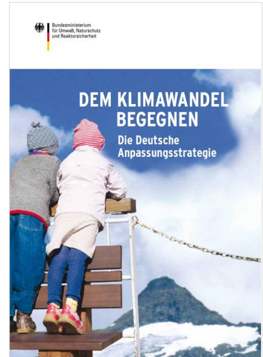
Broschüre des BMUB zur deutschen Anpassungsstrategie, Titelbild: Klaus Westermann/Caro