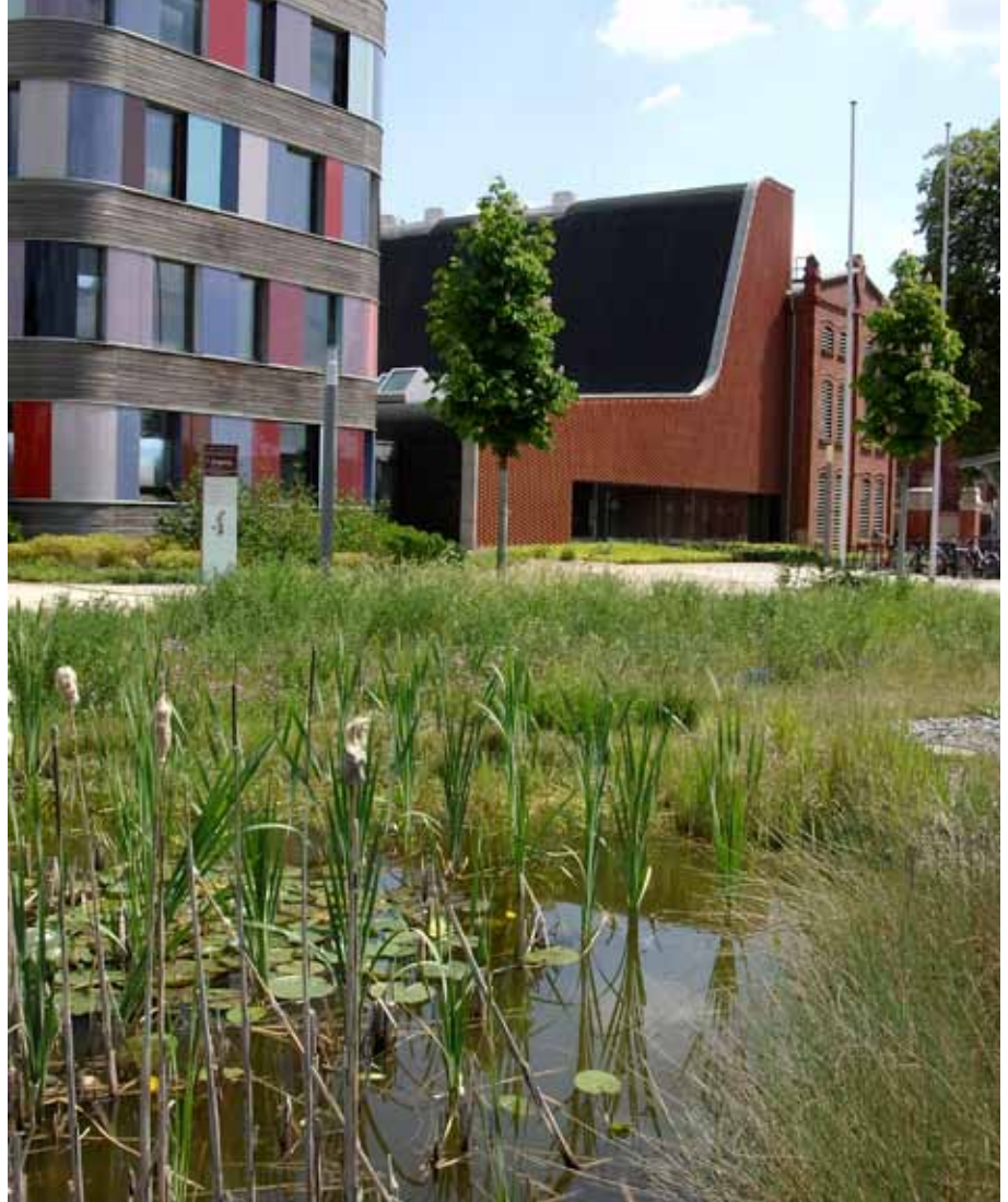
Das ökologische Muster-Gebäude des Umweltbundesamtes der Architekten Sauerbruch & Hutton (links) und das Bibliotheksgebäude Fachbibliothek Umwelt in Dessau-Roßlau, in das eine denkmalgeschützte Fabrikhalle des alten Dessauer Gasviertels integriert wurde

Mit der Auflösung des Bundesgesundheitsamtes und der Zusammenlegung des Umweltbundesamtes mit dem Institut für Wasser, Boden- und Luftthygiene im Jahre 1994 gab es nicht nur eine weitere größe-