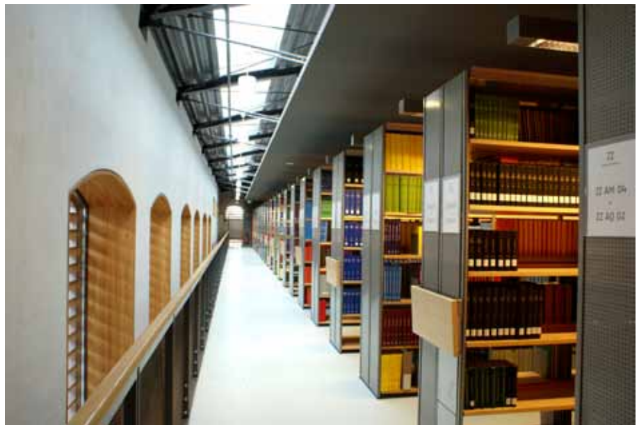
Die Grundbeleuchtung wird durch Fenster-Lichtbänder gewährleistet, an den Regalen schalten Bewegungsmelder bei Bedarf zusätzliche Lichtquellen ein.

Mail: bibliothek@uba.de Internet: www.umweltbundesamt.de Katalog: doku.uba.de Twitter: twitter.com@fabibumwelt