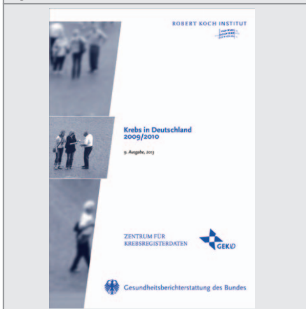
Abbildung 1: Titelseite der Broschüre »Krebs in Deutschland 2009/2010« (RKI, GEKID 2013).

In der aktuellen Ausgabe der Broschüre sind drei Kapitel, zum Vulvakarzinom und zum Pleuramesotheliom sowie zu seltenen Lokalisationen und zum nicht-melanotischen Hautkrebs, neu hinzugekommen. Dargestellt werden nun Ergebnisse zu 26 verschiedenen Krebsarten und zu Krebs gesamt. Sowohl wichtige Maßzahlen zu Erkrankungshäufigkeit und Sterblichkeit als auch Angaben zu Erkrankungs- und Sterberisiken sind in den einzelnen