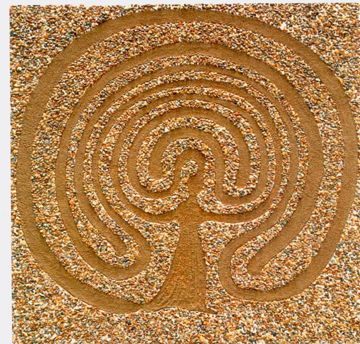
Mutter-Erde-Labyrinth in Schneverdingen von Ruthild Tillmann