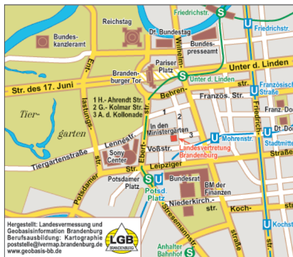
Tagungsort: 05.12.2011: Landesvertretung Brandenburg In den Ministergärten 3